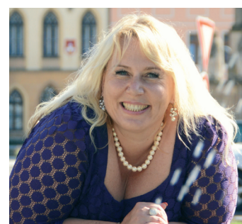
Klára Dostálová ministryně pro místní rozvoj, poslankyně ANO