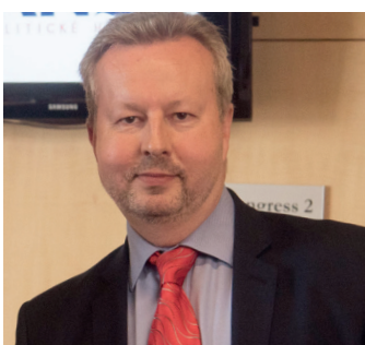
Richard Brabec ministr životního prostředí, poslanec ANO