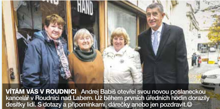
VÍTAM VÁS V ROUDNICI Andrej Babiš otevřel svou novou poslaneckou kancelář v Roudnici nad Labem. Už během prvních úředních hodin dorazily desítky lidí. S dotazy a připomínkami, dárčky anebo jen pozdravit.

Pro mě jsou krize vždy tou největší výzvou a v životě jsem jich zažil spoustu. Covid byl jeden z důvodů, proč jsme volby prohráli, protože ho opozice jako jediná v EU celou dobu politicky zneužívala proti nám. Piráti před volbami přiznali, že špatná covidová čísla jim v kampani hrála do karet. Já takhle neuvažuju. My v opozici nebudeme vládě kvůli covidu házet klacky pod nohy, jako to dělali oni. Jinak to nikdy nezvládneme. Pokud jde