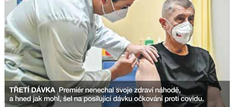
TŘETÍ DÁVKA Premiér nenechal svoje zdraví náhodě, a hned jak mohl, šel na posilující dávku očkování proti covidu.

Nepíše se mi to lehce. Nevím přesně, proč se to děje, nechápu to, ale stále častěji čtu v médiích, že agresivita vůči zdravotníkům a hygienikům v posledních týdnech nabírá na frekvenci, navíc se i stupňuje. Absolutně nerozumím tomu, jak může někdo nadávat lidem, kteří nám zachraňují životy a dva roky jsou na hraně fyzického a psychického vyčerpání. Jen proto, aby nám všem pomohli. Slovně útočit a agresivně křičet na zdravotníky na očkovacích místech, ale i na JIPkách, kde staří i mladí lidé bojují o život,